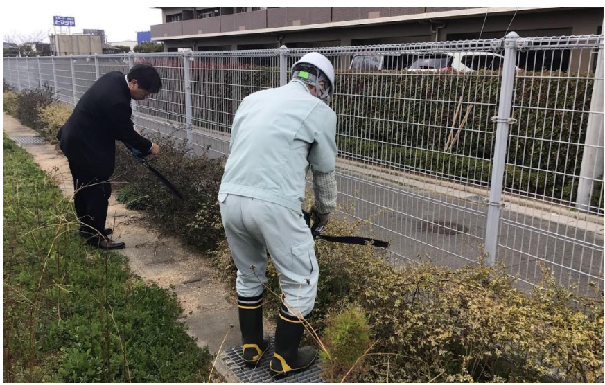
環境整備作業の様子