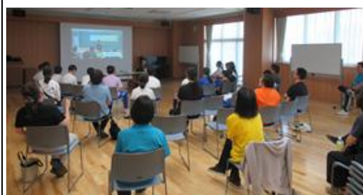
国際交流員によるスペイン講座