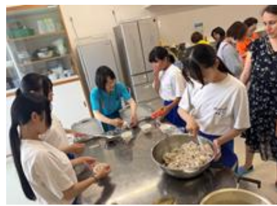
8月17日(日)の活動の様子