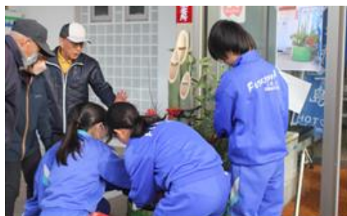
12月23日(火) しめ縄・門松づくり