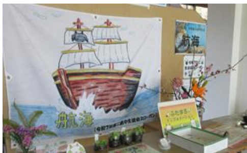
令和7年生徒会スローガン旗