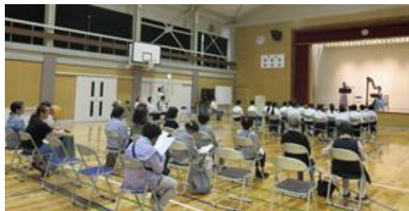
10月2日(火) ヴァイオリン・ハープ演奏会