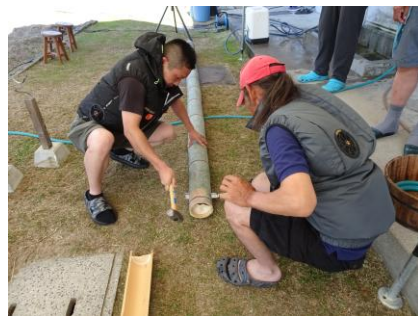
そうめん流し準備