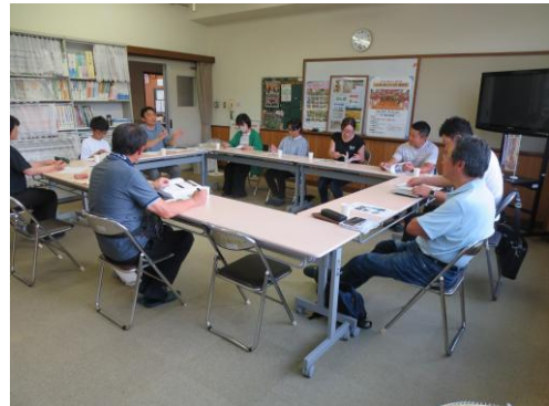
防災キャンプ打合せ