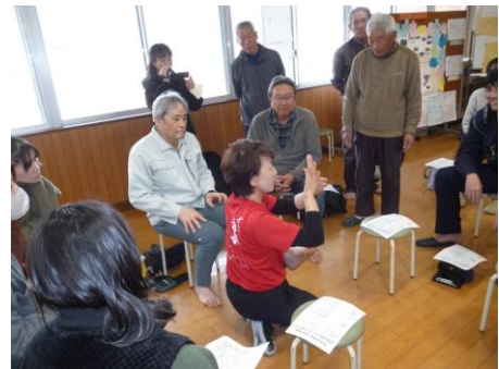
足のケアについて学ぶ