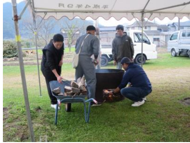
しし汁準備（おやじの会・CS）