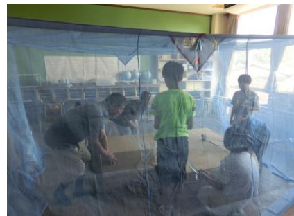
段ボールベッド作り