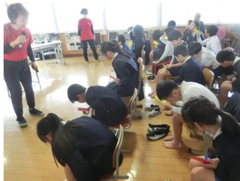
実際に足の形を観察