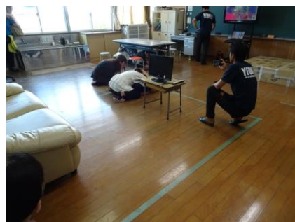
シェイクアウト訓練