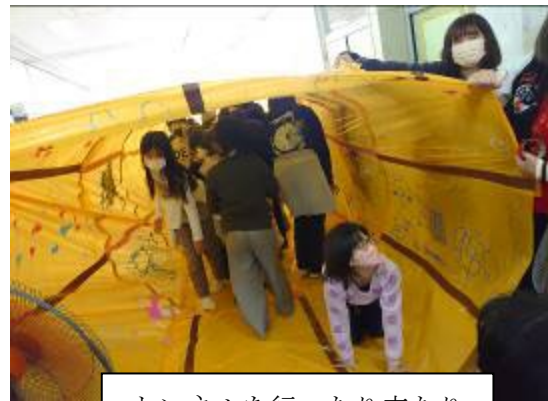
トンネルを行ったり来たり