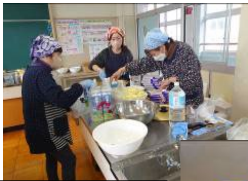
地域調理ボランティア