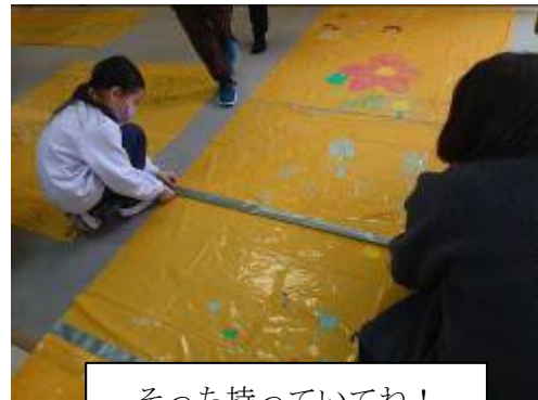
そっち持っていてね！