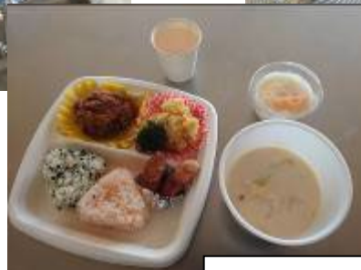
手作りのおいしいごはん