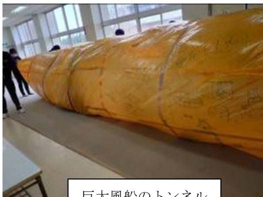
巨大風船のトンネル