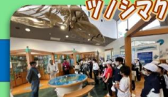
ツノシマクジラ つのしま自然館