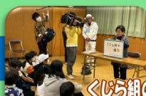
くじら組の遺蹟 角島伝説紙芝居