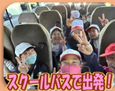
スクールバスで出発!

8:40 学校発 (バス) 9:00 大浦岳ふもと着 (登山) 10:00～11:00 大浦岳頂上 (下山) 12:00～13:00 ほうせんぐり海岸着 → 学校着 レクリエーション 昼食・レクリエーション