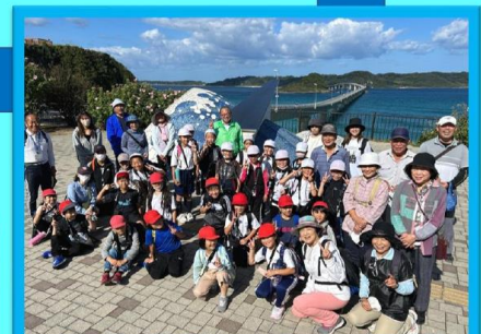
角島大橋を臨む絶景