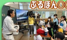
ふるぽん〇〇隊 テレビ撮影スタート

8:30 学校発 (バス) 8:50 角島公民館 (バス) 11:00 つのしま自然館 (バス) 12:00 角島小学校 (バス) 14:00 角島灯台 (バス) 14:30 角島大橋記念碑 (徒歩) 15:00 海士ヶ瀬公園 (バス) 15:30 学校着 レクリエーション 見学 昼食