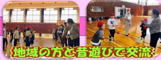
地域の方と昔遊びで交流