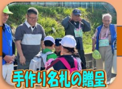
手作り名札の贈呈