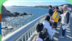
角島大橋を歩いて渡る!