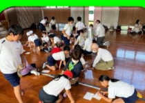
地域の方とレクリエーション