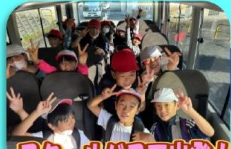
スクールバスで出発!

8:30 学校発 (バス) 9:00 ~ 9:15 旧神田小着 (徒歩) 10:00 ~ 10:30 海士ヶ瀬公園 (徒歩) 11:00 ~ 14:30 西長門リゾート (バス) 15:00 学校着 レクレーション・昼食・磯辺の体験教室