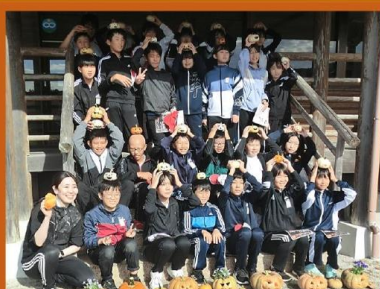
最高の小学校の思い出