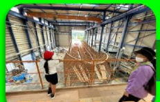
造船の現場を見学