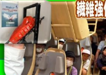
試乗! 1千万円の救命艇