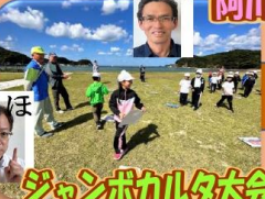
ジャンボカルタ大会