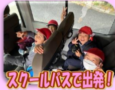
スクールバスで出発!

8:40 学校発 (バス) 9:10 二見港見学 (バス) 9:20 二見駅 (徒歩) 9:40 二見小外壁見学 (バス) 10:20 中原農園 (バス) 11:15 太翔館・勤労体育センター (バス) 11:30 14:10 学校着 太翔館見学・昼食・昔遊び 車中で夫婦岩見学