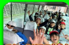
スクールバスで出発!

9:00 学校発 (バス) 9:15 ~ 9:50 JR栗野駅・ショートカット見学 説明会 (バス) 10:00 ~ 11:30 ニシエフ工場見学 (徒歩) 12:00 ~ 14:00 旧栗野小体育館 (バス) 14:30 学校着 昼食・レクリエーション