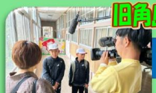
旧角島小学校 思い出の学び舎