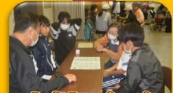
レクリエーション 神玉公民館