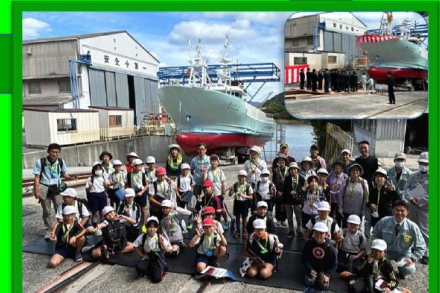
進水式もありました!