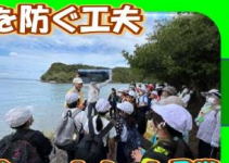
ショートカット見学