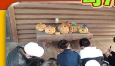
かぼちゃランタン