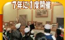
7年に1度開催 浜出祭の話