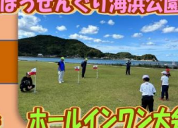
ホールインワン大会