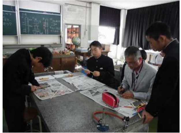
がりがりプロペラ