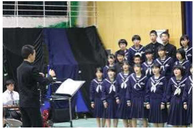
素晴らしい歌声の全校合唱