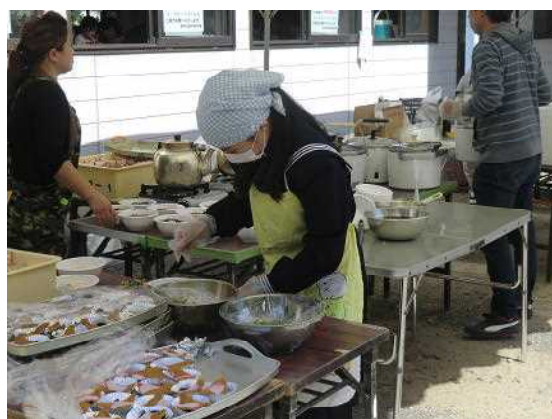
生徒の手伝い及び販売風景