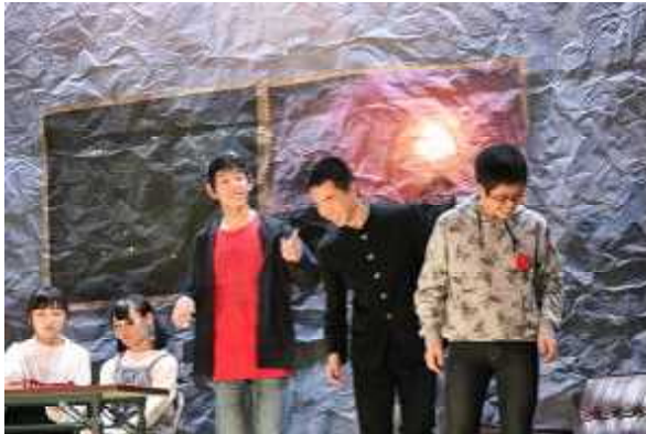
3年劇「蝶 いつの日か、輝いて」