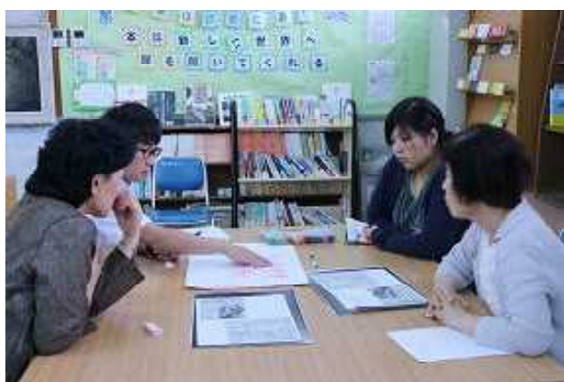
「若手教員による説明と真剣なまなざし」

んだ。普段は学校業務に追われ、みんなでじっくり検討する時間がなかったが、この度、学校運営協議会委員さんと一緒に話し合うことができたので、中学教員の固定概念では思いつかないような発想があり、とても刺激的であった。また、ファシリテーターは、教員経験1、2年目の先生教員が担当し、ベテランの教員がしっかりフォローし若手人材育成の機会として、OJTにもつなげることができた。最後の発表では、3人とも周りの意見をよく聞き、簡潔にわかりやすくまとめていた。今回、情報収集するアンテナの感度が高まったため、さらに幅広い分野から知恵を集めることができる。次回の熟議が楽しみで、よりよい学校行事の運営になっていくと思われた。