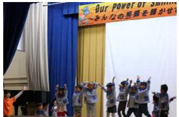
保育所園児による遊戯