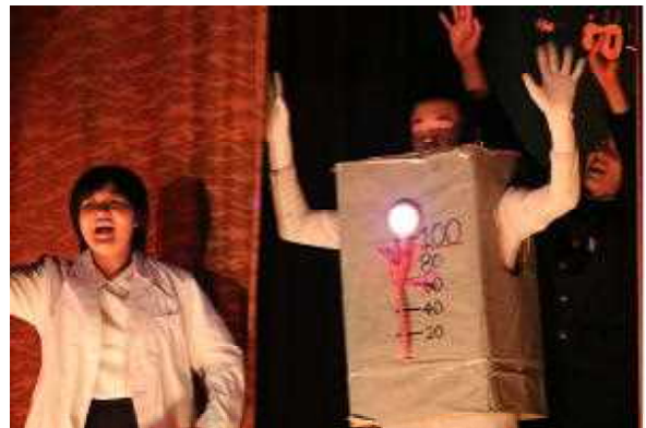
生徒会執行部によるエンディング