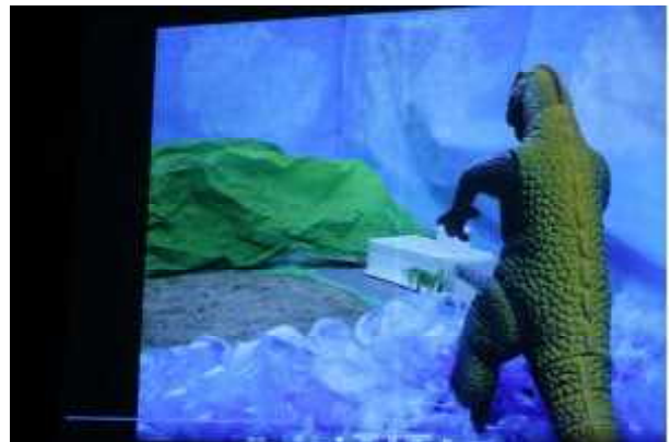
生徒会執行部によるオープニング