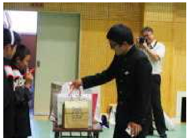
豪華賞品（会長・校長・教頭賞）をゲット！