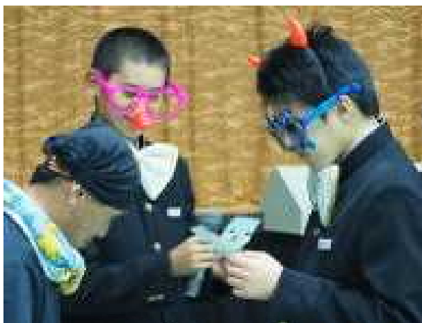
イベント係と会長によるビンゴ大会