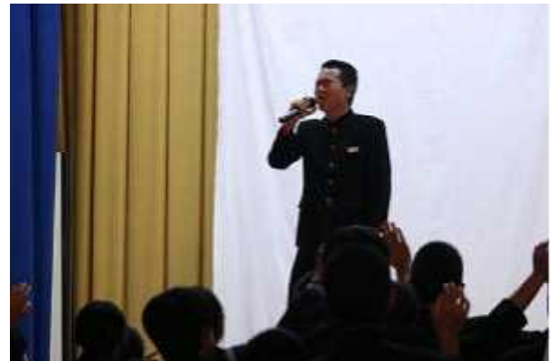
3年生の熱唱に観客も一体となって盛り上げた。