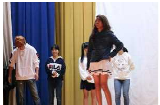
3年生有志と教員によるキレイのダンス