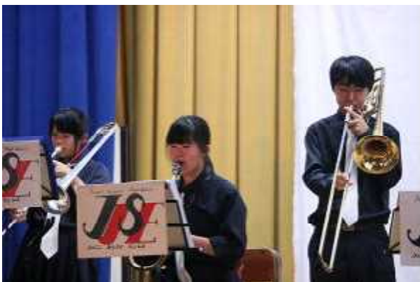
柳井学園高校 ジャズ演奏