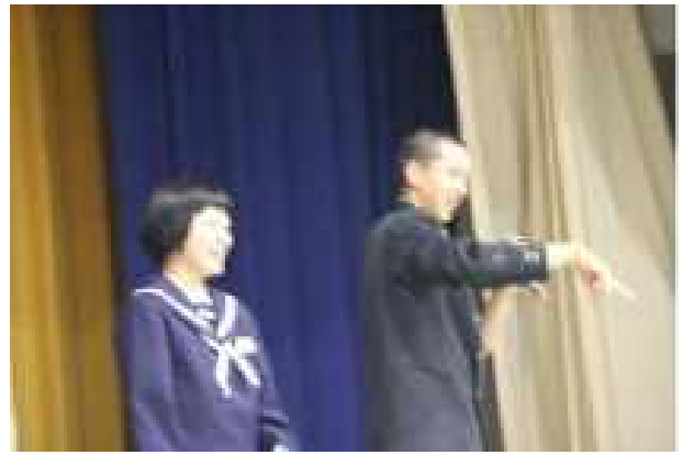
ぶっつけ本番の司会進行でも、息はぴったり