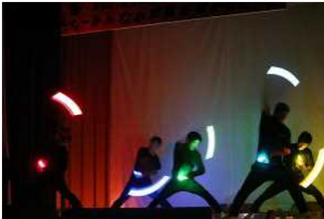
高校生によるパフォーマンス